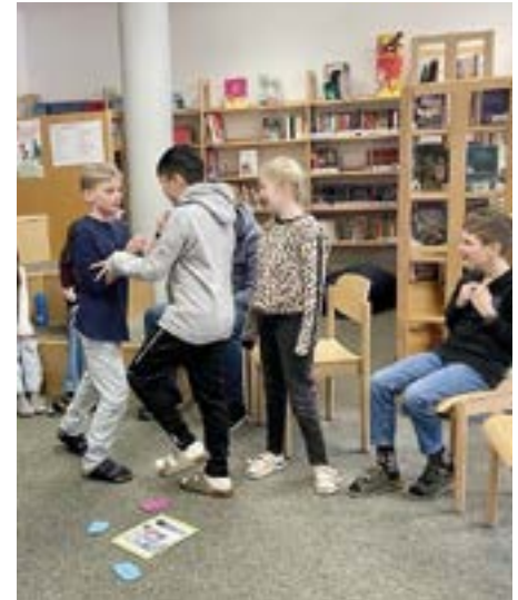
Workshop mit Körpereinsatz