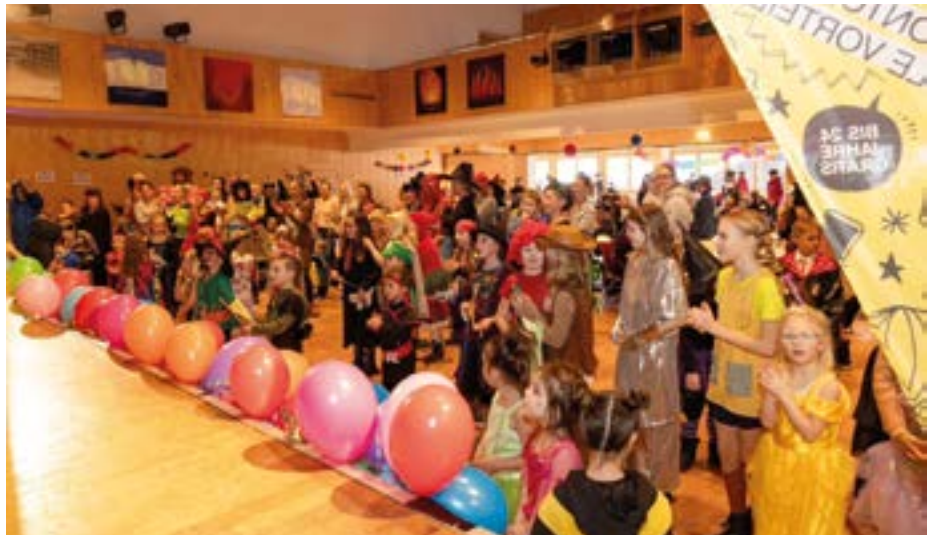
Der Gemeindesaal war voll beim Kinderfasching.

Großer Dank gilt an dieser Stelle auch den Sponsoren – StuBay, Schlick 2000, der Raiffeisenbank Wipptal–Stubaital, den Fulpmer Kaufleuten sowie fCup –,