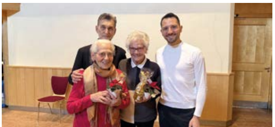
Die Jubilare