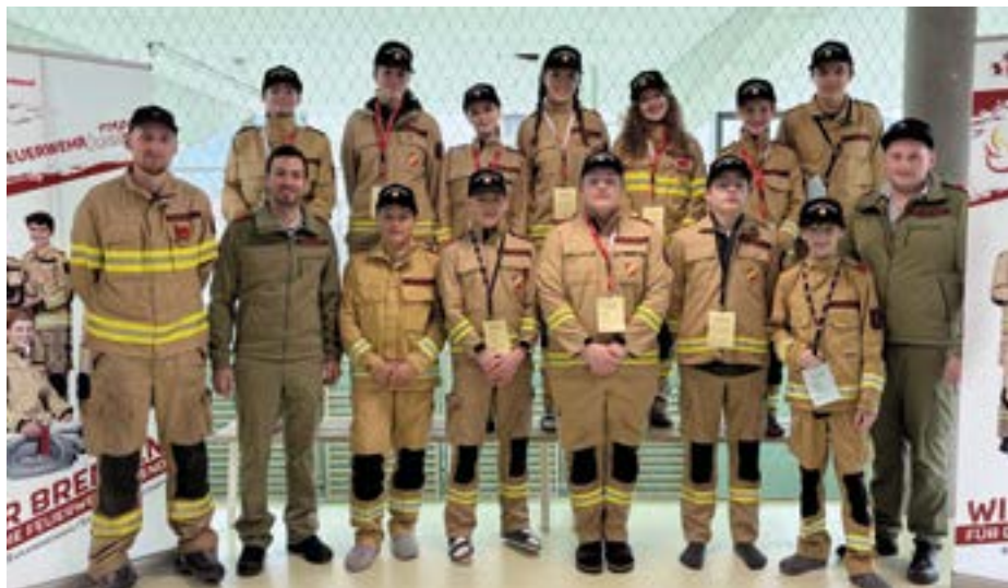
Die Teilnehmer unserer Feuerwehrjugend

Auch unsere 5 Mädels und 7 Burschen der Feuerwehrjugend Fulpmes traten in