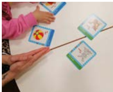
Lernen mit Zeichenkärtchen