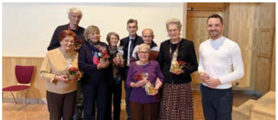
Die Jubilare