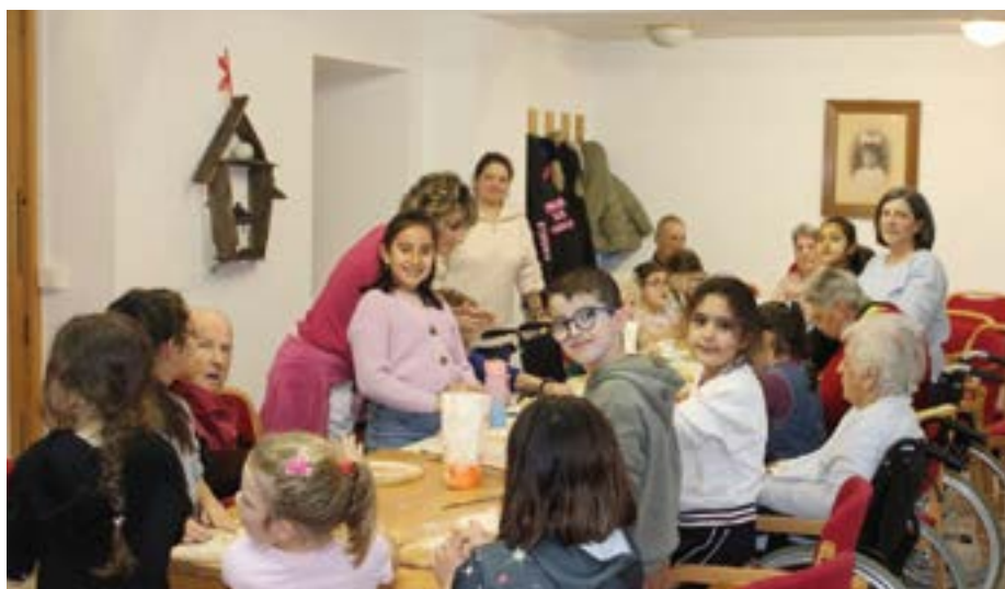
Soziale Kompetenzen