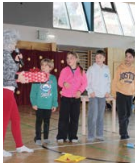
Vorfürhungen - Foto: Hort Fulpmes