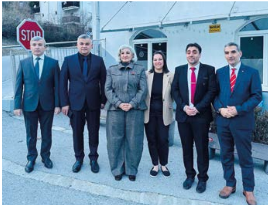
Hoher Besuch beim Verein ATIB

Wir bedanken uns herzlich bei allen Gästen und Helferinnen und Helfern für diesen gelungenen Abend.