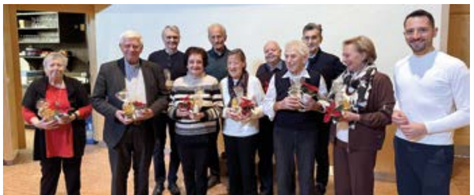
Die Jubilare