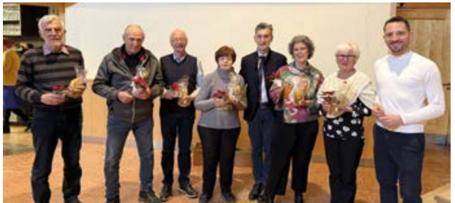
Die Jubilare