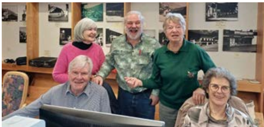
Digitale Kommunikation in der Gruppe erlernen