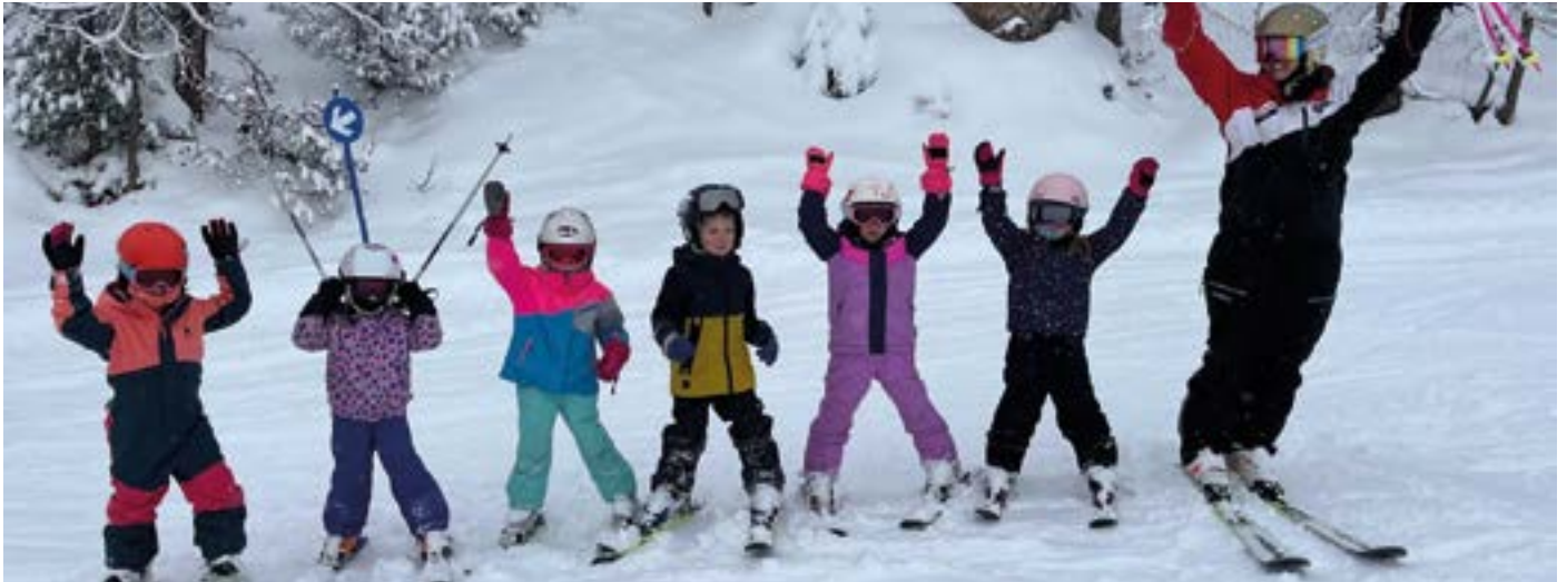
Beim traditionellen Kindergarten-Schikurs