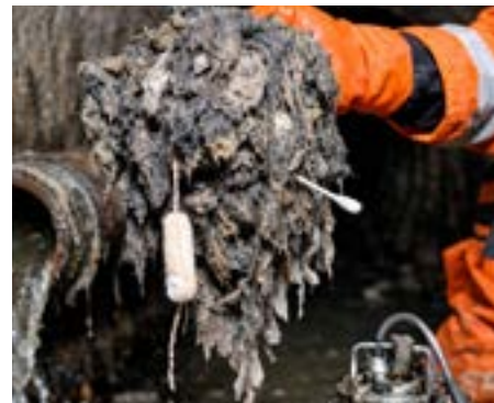
Hygieneartikel sind ein großes Problem im Kanalnetz.