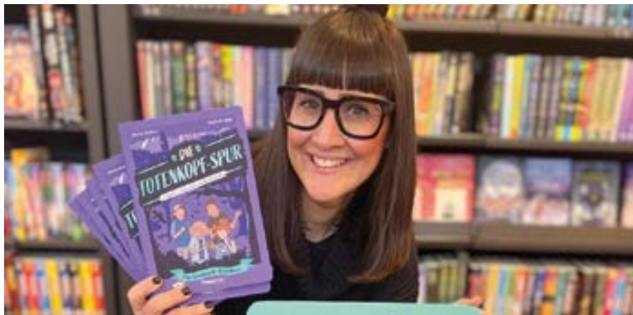
Die Kinderbuchautorin liest aus ihrem Krimi.