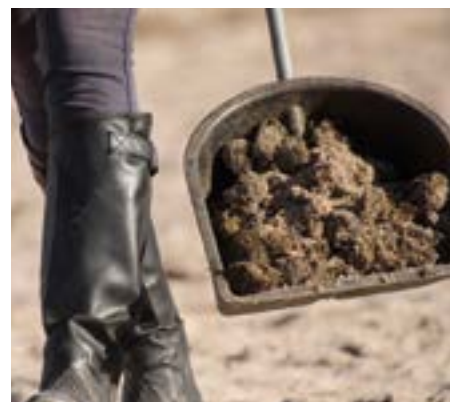
Pferdeäpfel sind sofort von Straßen und Wegen zu entfernen.