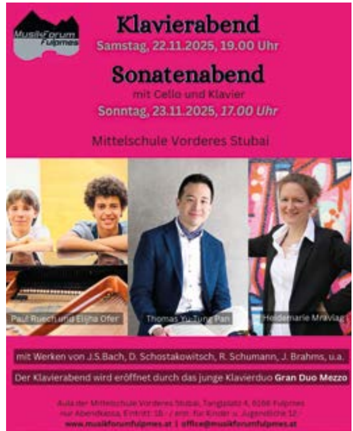
Klavierabend