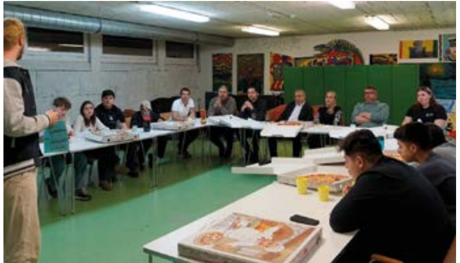
Das JuZe Fulpmes ist eine Einrichtung des Don Bosco Sozialwerk. Im Bild: „Pizza & Politik“ 2025 mit Politiker:innen aus Fulpmes und Telfes.

Mit dem Frühjahr beginnt auch die Planung für die großen und kleinen Veranstaltungen der kommenden Monate. Die „Walk on Water“-Challenge wird dabei heuer ebenso fester Bestandteil unseres Programms sein wie ein Fairplay-Fußballturnier Ende Juni (motivierte Mannschaften können sich gerne bei uns melden). Ein Besuch im Airparc war letztes Jahr ein voller Erfolg und soll wiederholt werden; den Adventurepark wollen wir gerne erstmalig erkunden. Auch unser Demokratieprojekt Pizza & Politik – bei