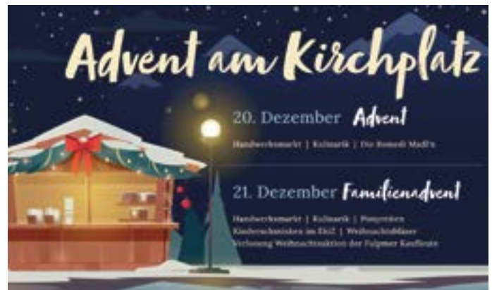
Adventmarkt Fulpmes 2025

Auch im Dezember 2025 läuteten die Glocken von zahlreichen Tuifl'n in Fulpmes und Medraz. Wie gewohnt fanden wieder Hausrunden in beiden Ortsteilen statt am 28. und 29. November 2025. Die Kinder durften sich am 04. Dezember in Medraz präsentieren. Highlight war natürlich wieder der große Tuifllauf am 05. Dezember am Kirchplatz Fulpmes, wo im Anschluss dann im Gemeindesaal die Aftershowparty mit DJ Penzo stattfand. Hervorzuheben ist, dass die Fulpmser Tuifl am 24. Dezember wieder einen Scheck über € 4.000 an eine Familie im Stubai übergeben haben. Danke!