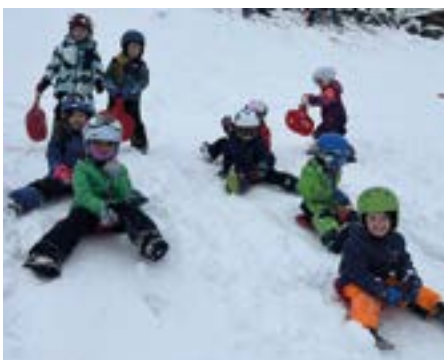
Am Rutschblatthügel am Dorfbrand