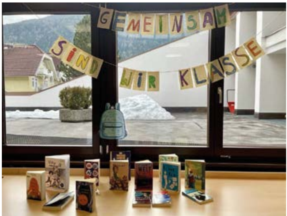
Motto in einer Klasse