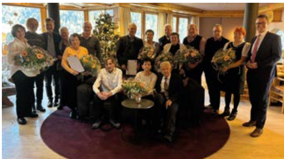
Die Jubelpaaren (nicht im Bild: Mair Ewald und Annelies)