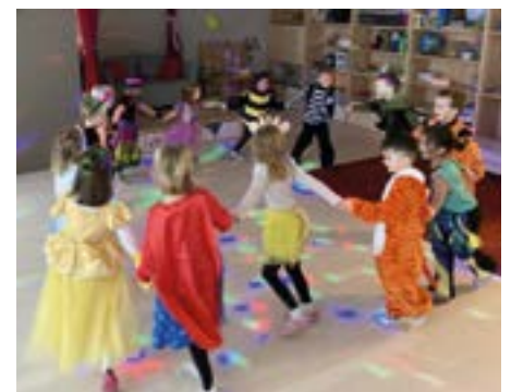
Ausgelassen am Faschingsdienstag