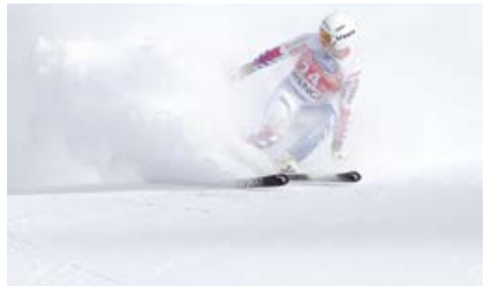
10. Schlicker Skimeisterschaften

Der ausverkaufte Theaterball in Fulpmes, der nur alle drei Jahre stattfindet, bot unter dem Motto „Schwarz-weiß“ ein abwechslungsreiches Programm. Musik von den Bergmännern und mehrere Showeinlagen sorgten für beste Stimmung. Neben einem Black & White-Dance und einem humorvollen Banküberfall wurden mit „Club 2“, „Dinner for one“ und „Liebesg'schichten und Heiratssachen“ bekannte TV-Klassiker aufgegriffen und das Dorfgeschehen satirisch beleuchtet. Der abwechslungsreiche Ballabend begeisterte das Publikum bis spät in die Nacht.