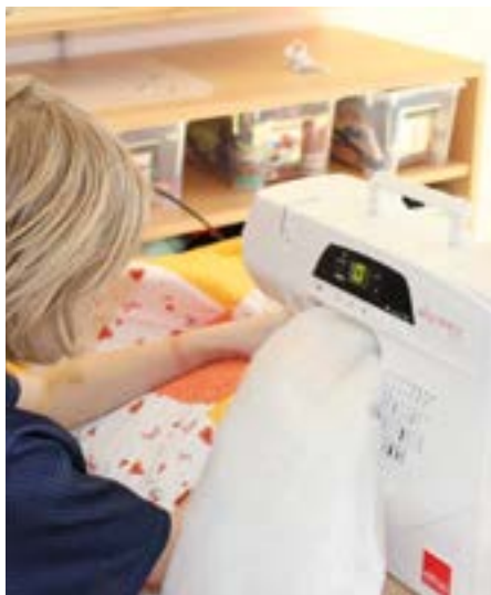
Handwerkliches Geschick