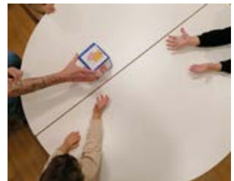
Offene Kommunikation am Tisch