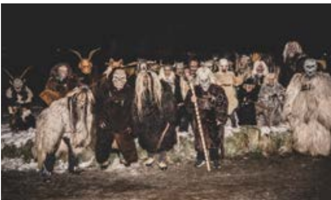
Fulpmser Tuifllauf 2025