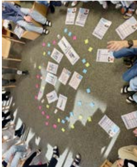
Gedanken der Kinder