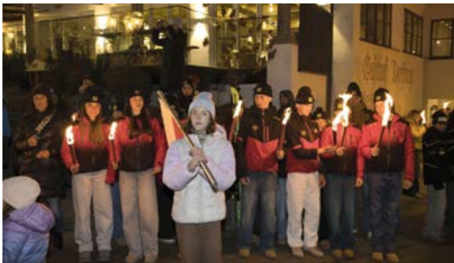
Die Athleten beim Fackeleinmarsch