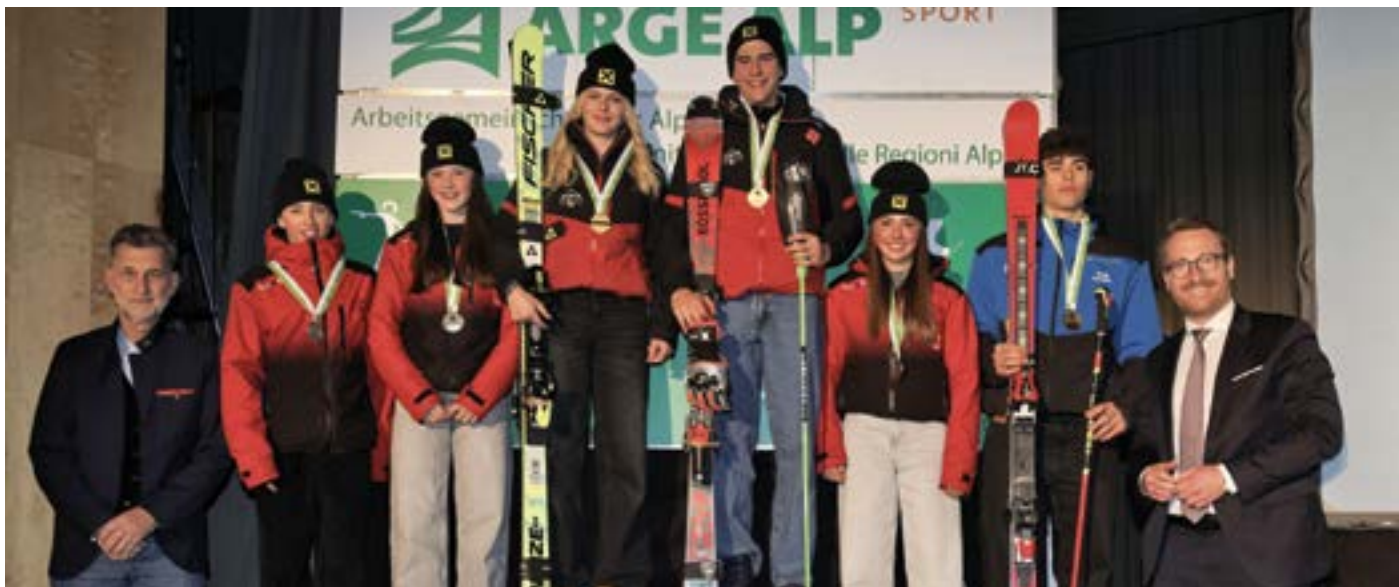
Die Sieger beim Riesentorlauf am Samstag

Spannende Rennen, starke Leistungen und echter Teamgeist: Beim Arge Alp Skirennen 2025 in Fulpmes zeigten junge Skitalente ihr Können. Tirol überzeugte mit Top-Platzierungen und großem Erfolg!