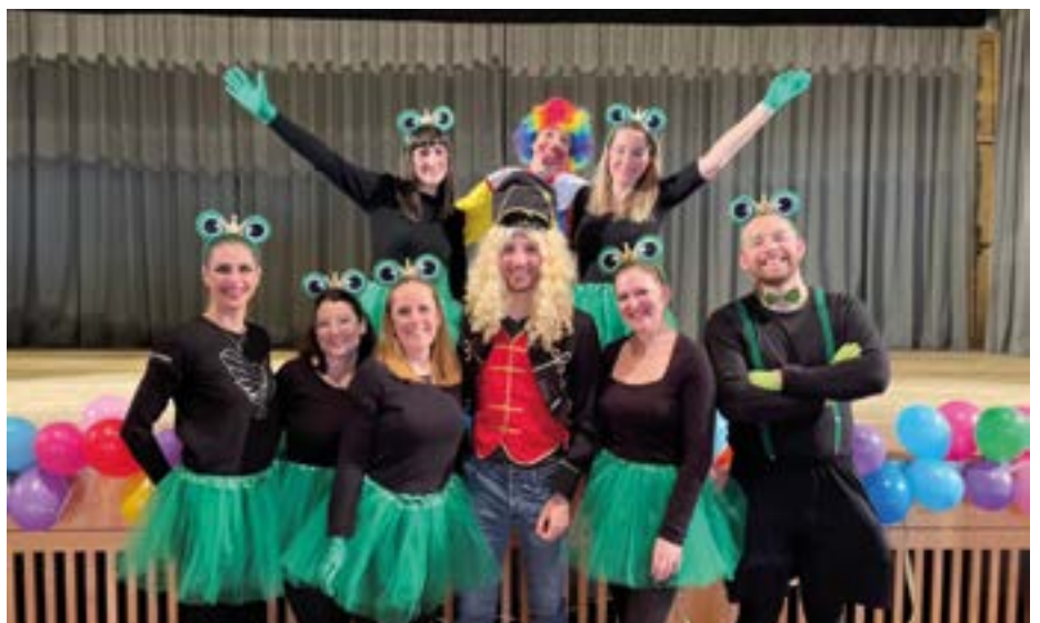
Das Organisationsteam.

die mit ihrer wertvollen Unterstützung maßgeblich zum Gelingen beigetragen haben.