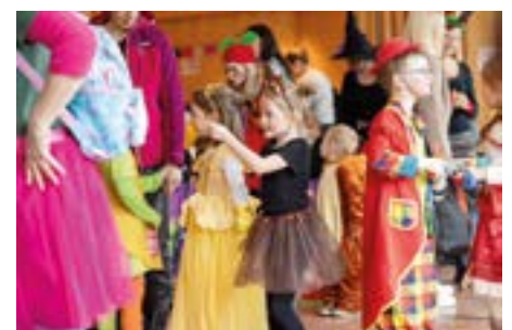
Es wurden auch unterhaltsame Einlagen geboten.