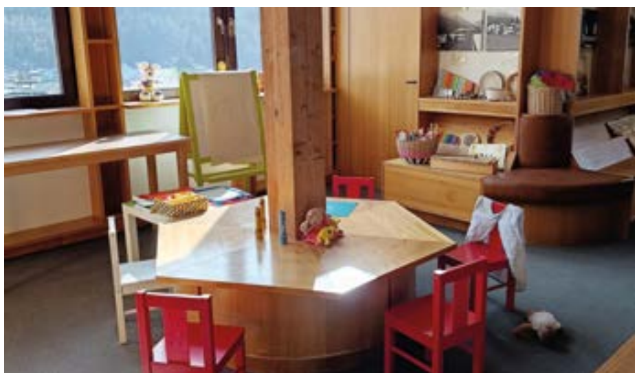
Sitz- und Spielecke

von 10.00 bis 12.00 Uhr ). Hier haben Eltern die Möglichkeit, Fragen rund um Schwangerschaft, Geburt und die erste Zeit mit dem Baby individuell zu besprechen und sich fachkundig beraten zu lassen.