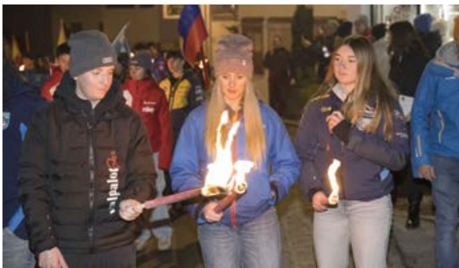
Arge Alp bedeutet auch Verbindung über Ländergrenzen hinweg - Foto: Tiroler Schiverband