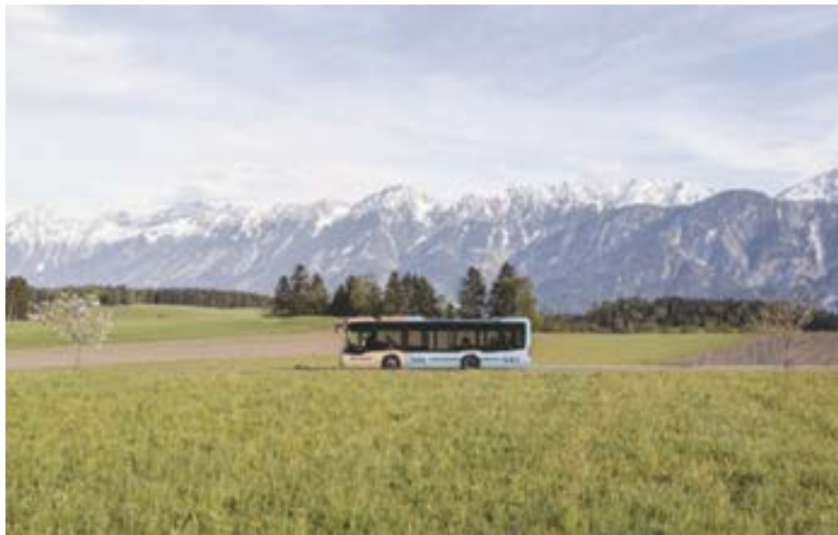
Mehr Öffi für Einheimische und Gäste

Das neue Angebot gilt für alle sieben Wochentage. Dabei wird der Öffi-Verkehr an den Tagesrandzeiten erweitert: Die Busse fahren von Montag bis Samstag von 6 bis 20 Uhr und am Sonntag von 8 bis 18 Uhr. Damit gibt es insgesamt ein dichteres Angebot, das verbesserte Verbindungen aus dem Stubai- sowie dem Wipptal und seinen Seitentälern an die Schiene und nach Innsbruck (und retour) sicherstellt. Konkret betreffen die Änderungen die Buslinien 590, 595, 4143, 4144, 4145, 4146 und 580. Das neue Konzept wurde vom VVT über Monate gemeinsam mit VertreterInnen aus der Region erarbeitet, abgestimmt, ausgeschrieben und tritt am 2. Mai 2026 in Kraft. Es gilt ab dann für die kommenden zehn Jahre.