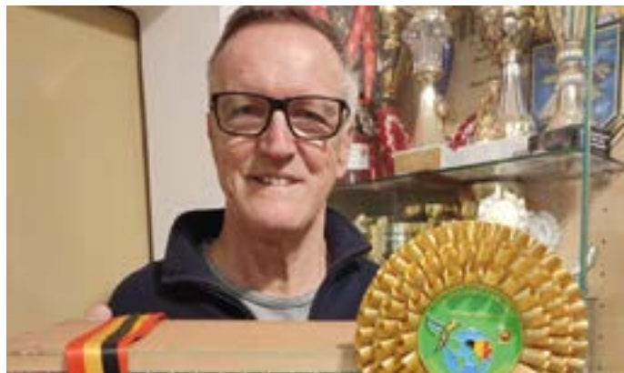
Hans Tembler