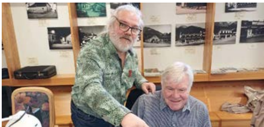
Aktuelle IT-Themen gemeinsam erarbeiten