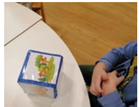
Auch mit dem Würfel wird Sprache erfahren