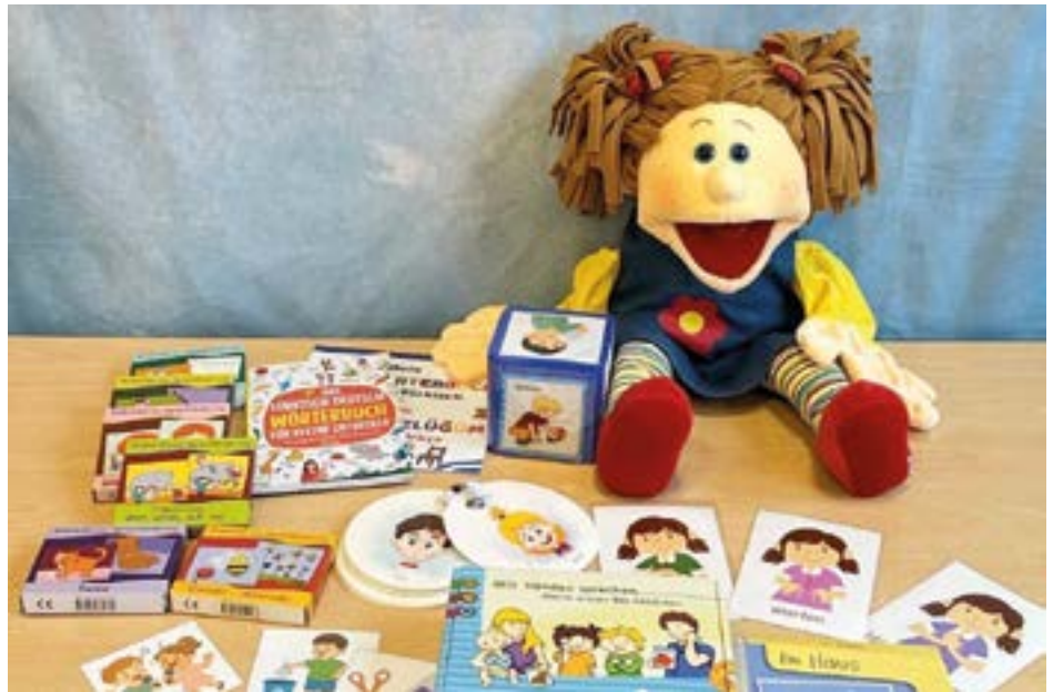
Begleitutensilien für die Sprachförderung