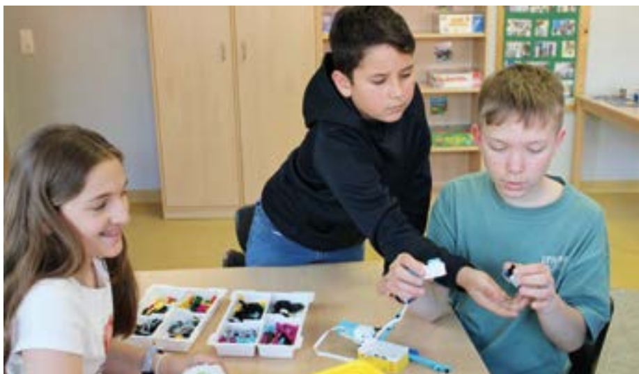
Technische Neugierde